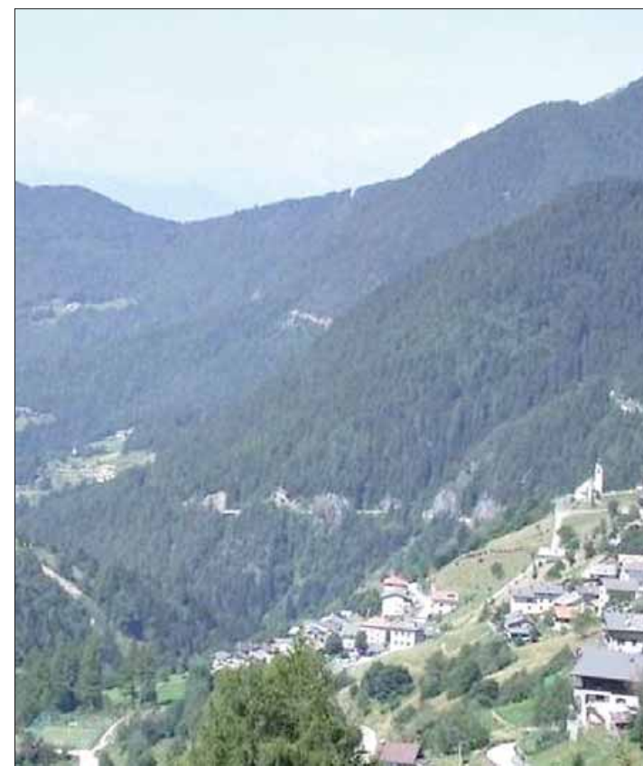
Una veduta della valle dei Mocheni

Il boom di nuovi residenti durante la pandemia ha toccato anche l'altopiano della Paganella, che nel 2013 faceva registrare 3.624 abitanti, arrivando nel 2020 ad averne 3.861 , per poi assestarsi, infine, sui 3.752 del 2022. Numeri che in questo ca-